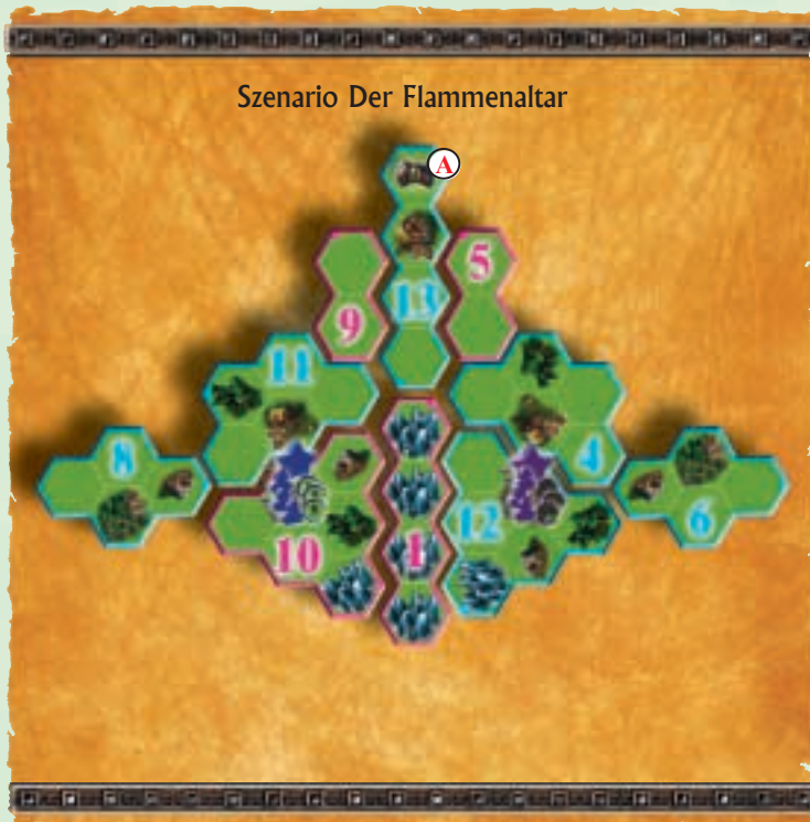
Szenario Der Flammenaltar