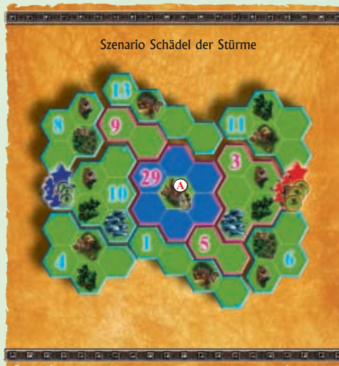
Szenario Schädel der Stürme