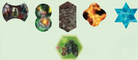
Baum der Ewigkeit der Nachtelfen

Eins dieser Plättchen ist der "Baum der Ewigkeit". Dieses Plättchen stellt das mobile Dorf der Nachtelfen in den optionalen Regeln für die neuen Fähigkeiten der Völker dar, die gleich noch genau erklärt werden.